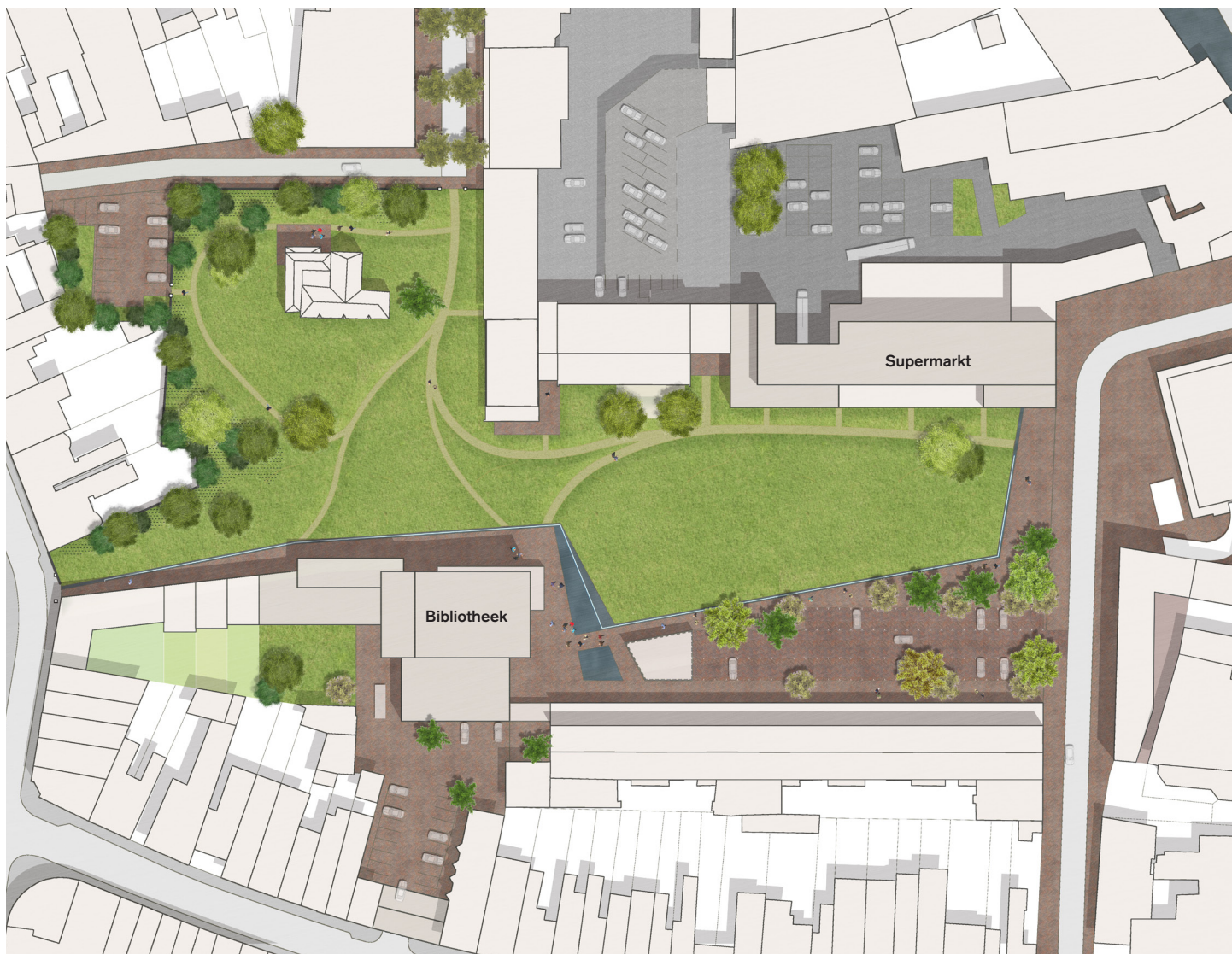
ONDER: Inplantingsplan van het voorkeursscenario, met bibliotheek en carrefour